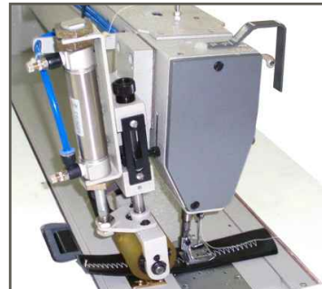
*Optional rear pneumatic puller *Puller neumático disponible.